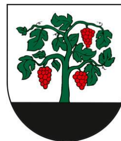
Obrázok 4 Erb obce Černochovo

Erb obce Černochovo tvorí V striebornom štíte z vysokej čiernej rovnej pažite vyrastajúci zelený hrubý vinič vpravo s jedným, vľavo s dvoma červenými strapcami hrozna.