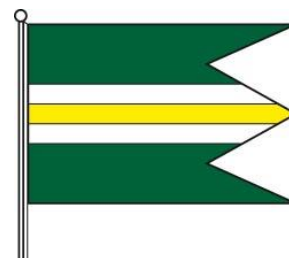
Obrázok 3 Vlajka obce Bara

Vlajka obce Bara pozostáva z piatich pozdĺžnych pruhov vo farbách 2/7 zelená, 1/7 biela, 1/7 žltá, 1/7 biela a 2/7 zelená. Vlajka má pomer strán 2:3 a ukončená je troma cípmi, t.j. dvoma zástrihmi, siahajúcimi do tretiny jej listu.